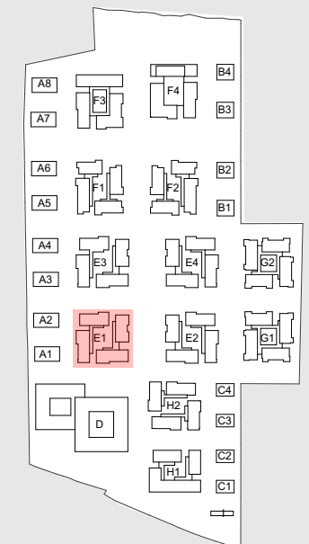
COUPE SUR APPARTEMENT N° E1 - 06 - 26